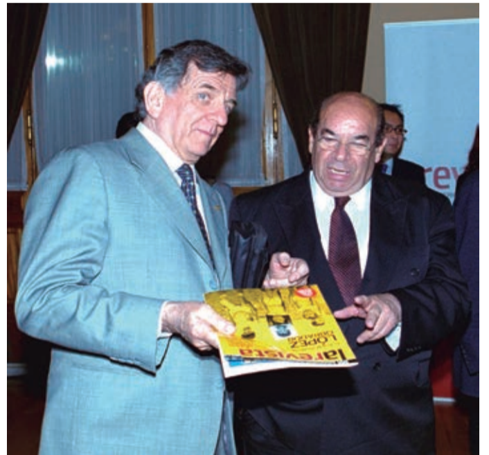
Se ha marchado un gran Universitario a la edad de 71 años.