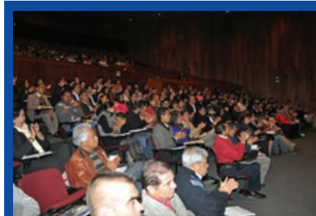
DOS EDICIONES MÁS DE LAS JORNADAS DE ACTUALIZACIÓN JURÍDICA

El documento, que ya fue presentado ante los gobernadores del país, será conocido oficialmente por el Senado de la República y por todas las personas e instituciones responsables de elaborar las políticas que sobre ciencia y tecnología adopte nuestro país en los próximos años, con la firme expectativa de utilizarlas como herramientas fundamentales para su desarrollo.