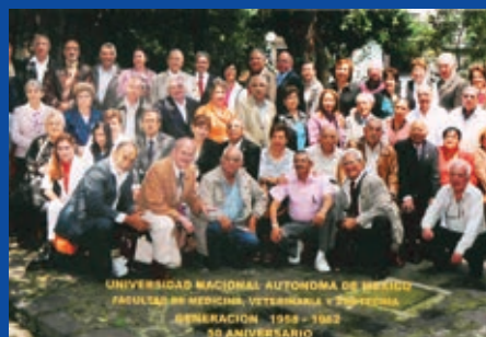
GENERACIÓN 62, VETERINARIOS ¿QUÉ SON CINCUENTA AÑOS?