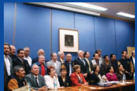
ASOCIACIÓN MORELENSE DE EXALUMNOS DE LA UNAM