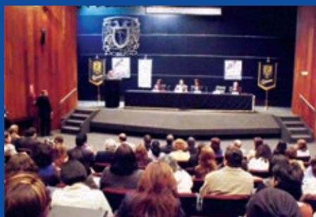
CONGRESO DEL AMOCOAC Y DEL COMEI EN LA UNAM