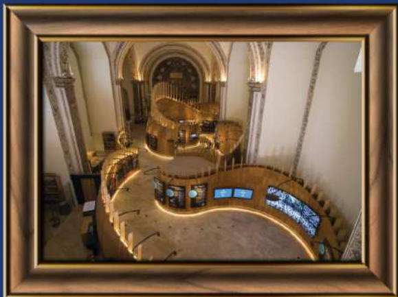
Museo de las Constituciones