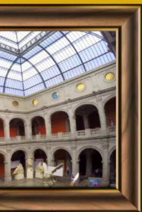
Academia de Carlos