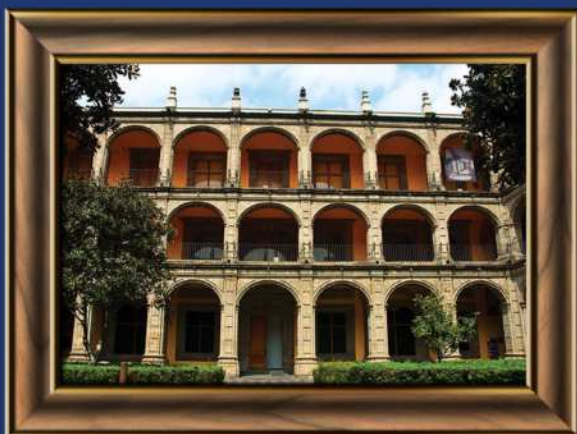
Antiguo Colegio de San Ildefonso