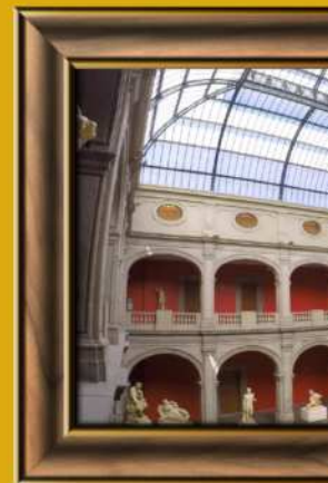
Acad de San