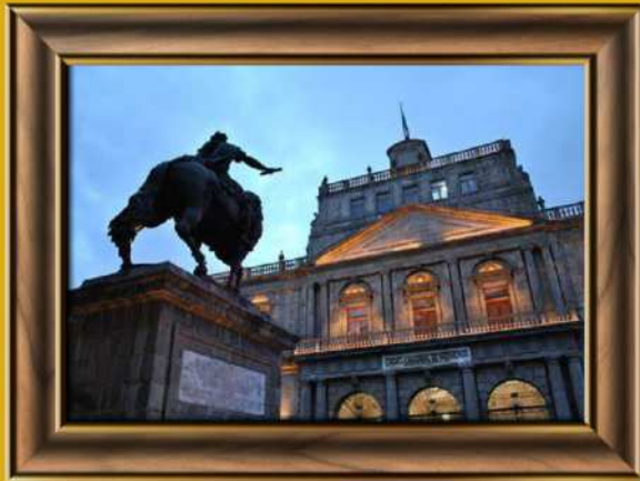
Palacio de Minería