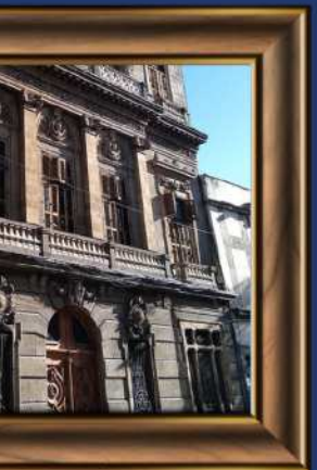
Escuela de Economía