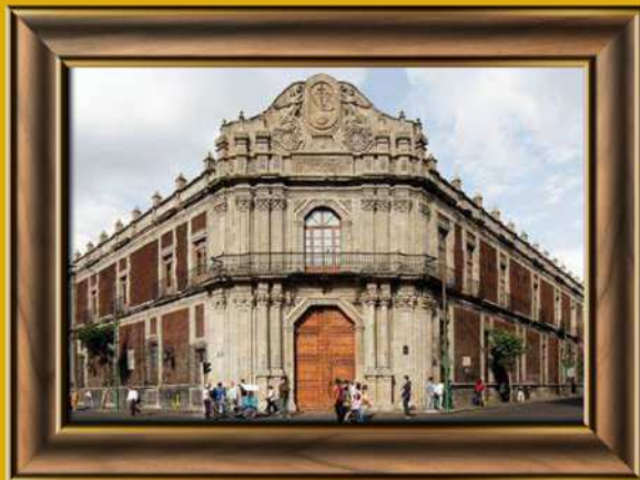
Palacio de la Escuela de Medicina