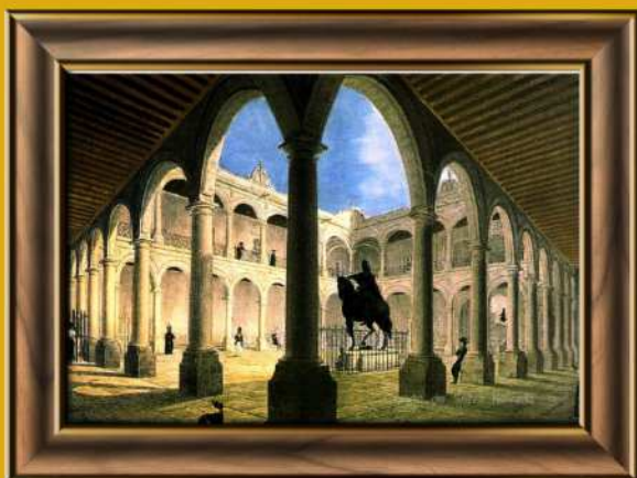
Real y Pontificia Universidad de México