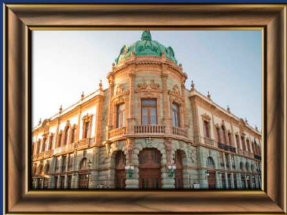
Palacio de la Autonomía