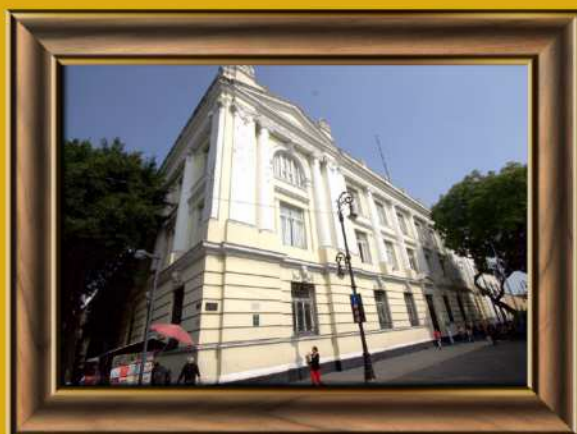
Antigua Escuela de Jurisprudencia